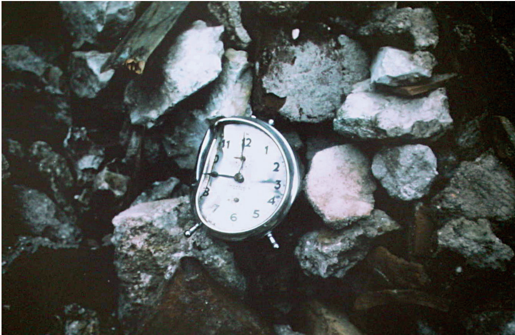
Friuli, 6 maggio 1976, ore 21:00 (fotografia di Renato Candolini, per gentile concessione).