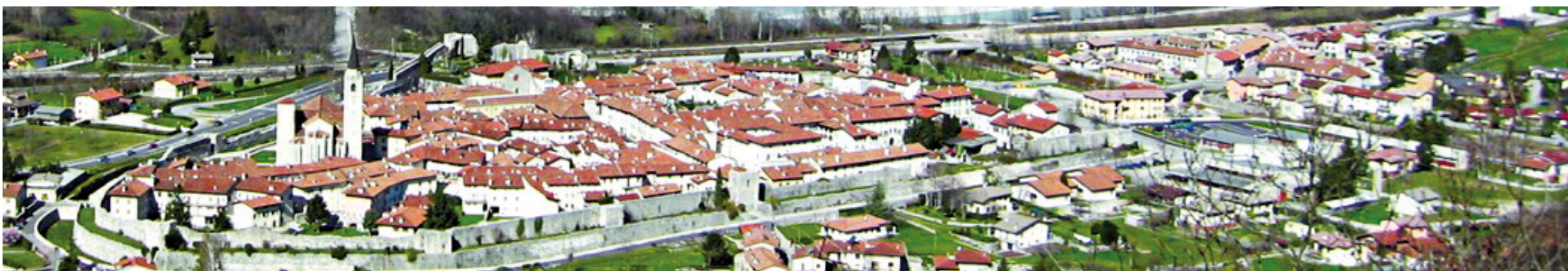
Venzone: prima del 6 maggio 1976; dopo il terremoto del 6 maggio; dopo i terremoti del 15 settembre 1976; dopo la ricostruzione.